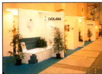
Le tout premier stand d'Isolava à Batibouw. Il y a quatorze années, Isolava était déjà de la partie. Ce stand n'a rien en commun avec l'étiquette sous laquelle Isolava se présente désormais depuis quelques années.

intérieures ne ressort pas seulement des chiffres, mais aussi du nombre considérable de bons contacts noués à Batibouw. A l'évidence, les architectes et les entreprises de parachèvement se sont faits convaincre des avantages que représentent les produits Isolava. La rapidité de construction et de parachèvement et la méthode de finition à sec sont considérées comme des atouts importants. Il est également apparu le long des dernières années que l'isolation acoustique et la protection incendie suscitent davantage d'attention. Sur ce terrain, Isolava offre également des solutions très efficaces à des prix très démocratiques.