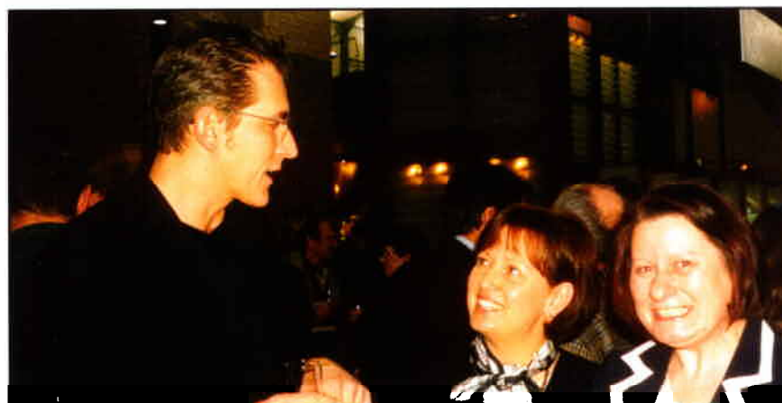
Rob a réalisé sans grande peine ce quatorzième défi.