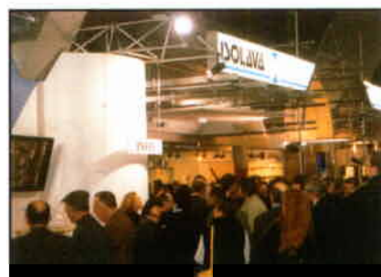
Tant le 14ième défi de Rob que la présentation des produits Isolava ont suscité des réactions très positives dans le public qui s'était déplacé massivement.